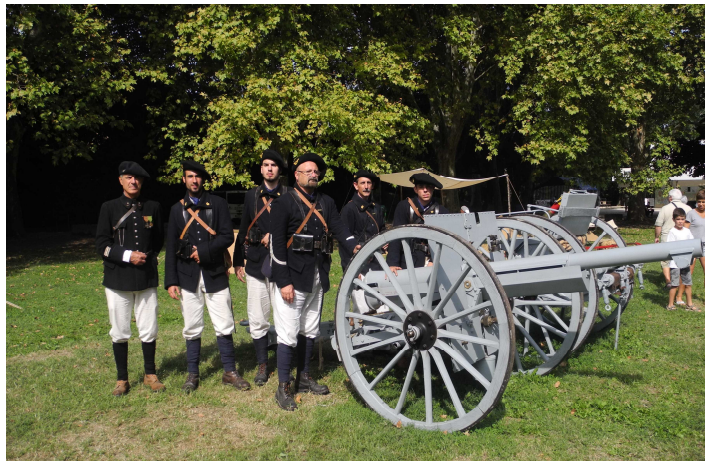
Collecte au profit du Bleuet de France

Dépôt de gerbes au monument aux morts. La cérémonie sera animée par l'association d'histoire vivante et d'archéologie expérimentale qui sera présente avec un canon de 75 mm, le « roi des canons » et avec dix hommes en uniforme de la Grande Guerre et suivie d'un apéritif.